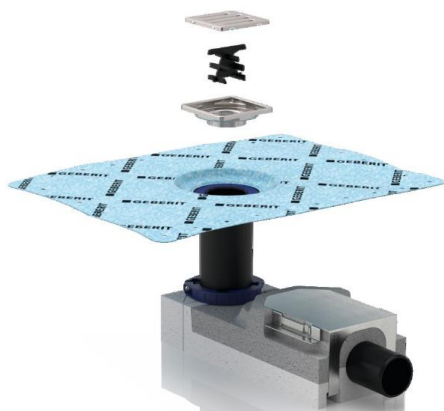
Fig. 3 Geberit gulvsluk for rist – Slukrist Standard Figur: Geberit AS