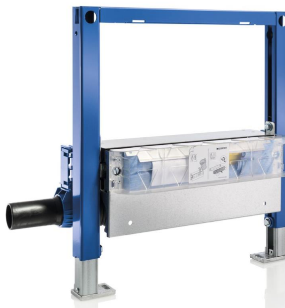
Fig. 1 Geberit Duofix veggsluk

Geberit vegg- og gulvsluk kan benyttes i boliger, hoteller, dusjanlegg og andre bygninger og lokaler med tilsvarende bruksforutsetninger. Geberit veggsluk med slukmansjett skal monteres i vegg ved gulvnivå, se fig. 4.