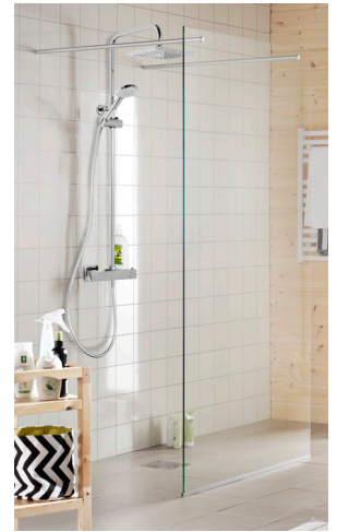
Klarglas DV 115