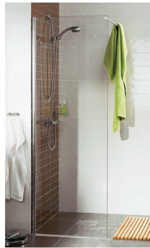
Klarglas DV 70, 80, 90