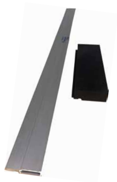
Nobbnr. 57171164 Monteringsverktøy

* Dette er viktig. Skjøtene skal ikke sparkles, men pusses lett med et 240 sandpapir etter første malingsstrøk. Deretter males 1-2 strøk til. Pusser du for hardt eller med for grovt papir tar du bort strukturen i grunningspapeten.